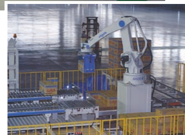
パレタイズロボット (Palletizing Robot)

段ボールに詰めた製品をパレタイズロボットがパレットに積み上げ、工場内の製品倉庫で保管されます。