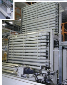
アキュムレーター(Accumulator)