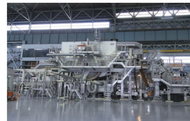
抄紙機 (Paper Machine) [クレセントフォーマー(Crescent Former)]

調整された原料を抄造し、ドライヤーで高温滅菌し乾燥させ、原紙(ジャンボロール)として巻き取ります。この高速抄紙機(イタリア/A・Celli社製)はクレセントフォーマー方式を採用しています。