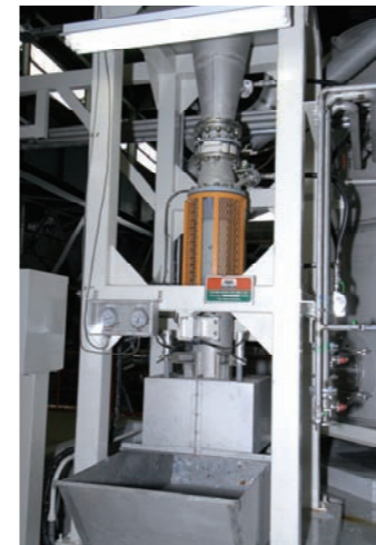
リキッドサイクロン (Liquid Cyclone)

原料を高速に回転させて、遠心力の働きで金属類、プラスチック類などの異物を取り除きます。