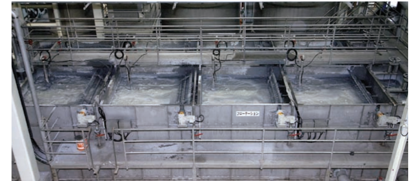
フローテーション(Floatation)

水中式脱墨フローテーターを設備したこの装置は水中エアレーション方式のため、優れた脱墨能力を持ち、高い白色度が得られます。タービン羽根を利用した独特なエアレーションで気泡の表面にインキ分(墨)を付着させ、除去します。